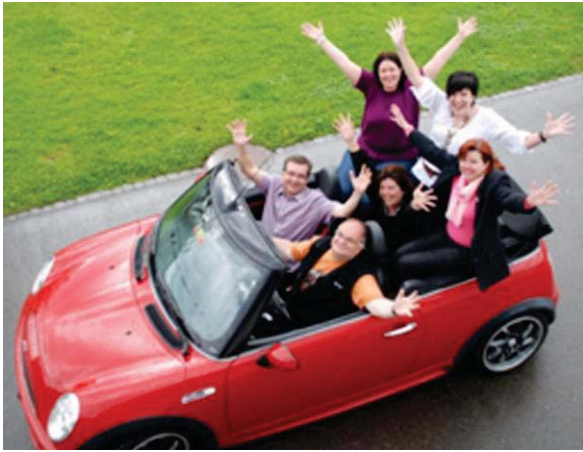
Praxis durch Projekte. Wir kommen immer an unser Ziel, egal wie. Das Projektteam e-chancen II