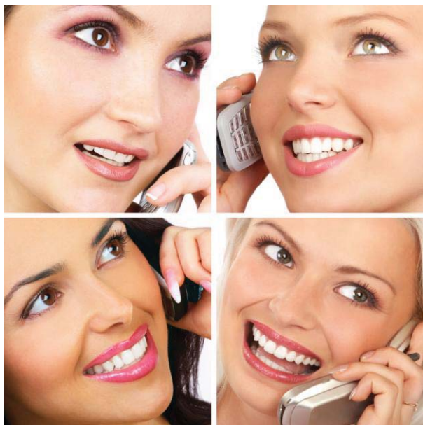
Assistent/in Empfang und Telefon - Administrative Grundlagen im Selbststudium und viel Praxisanteil