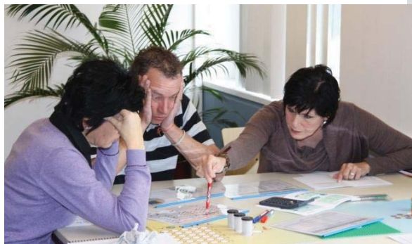
Viele Formulare – wer behält da den Durchblick?