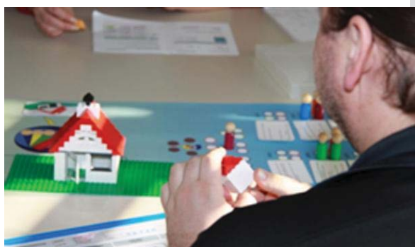
Auf diese Steine können Sie bauen. Das Legotraumhaus.