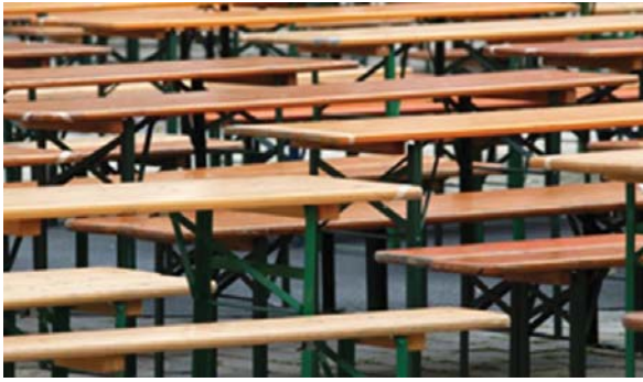
Festbankgarnituren von impuls – geprüfte Sicherheit