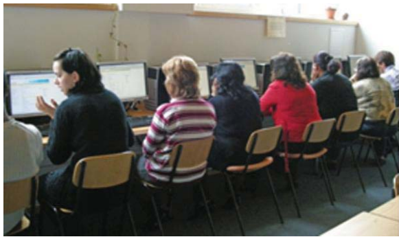
Einmal gelernt ist eigentlich alles gar nicht so schwer