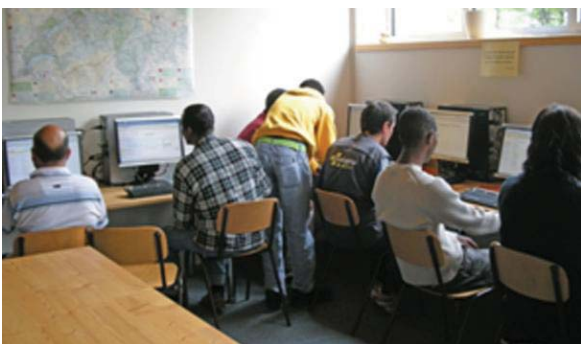
Klicken hier, klicken dort. Die Mühe lohnt sich