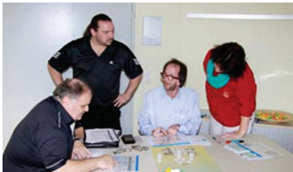
Projektopolis – Totale Ratlosigkeit zu Beginn