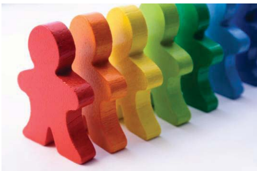
Mentalwerkstatt – motiviert auf Stellensuche